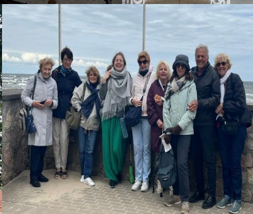
Nous n'avons mis qu'un pied dans la Baltique, devinez pourquoi.