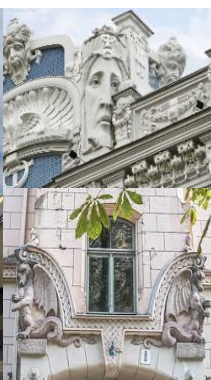
Riga avec aussi ses immeubles arts déco