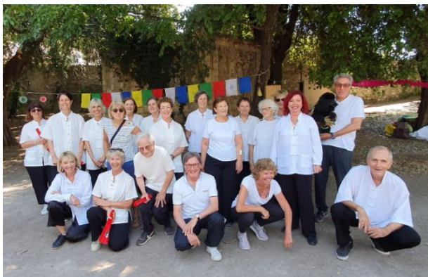
Juin 2025- Une partie du groupe de pratiquants