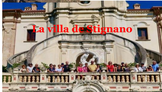
La villa de Stignano